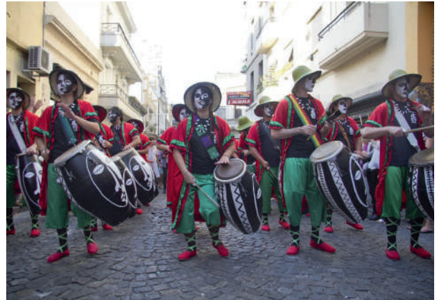
Candombe en Uruguay.

Fue muy importante la influencia cultural de los esclavos africanos traídos al continente entre los siglos XVI y XIX para servidumbre y trabajos forzados en minas y plantaciones . La mayoría fueron trasladados al caribe , centroamérica y dominios portugueses del actual Brasil . Su cultura enriqueció y llenó de matices las ya existentes, dejando un legado en expresiones como la música con huella africana en ritmos característicos como el candombe , la rumba o el merengue entre otros.