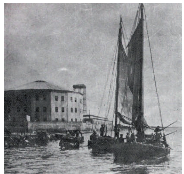
Primer hotel de inmigrantes en Buenos Aires. Funcionó entre 1880 y 1911.

La multiculturalidad es un concepto que alude a la convivencia en un mismo espacio social y geográfico de personas de diferentes razas , religiones , cultura y tradiciones .